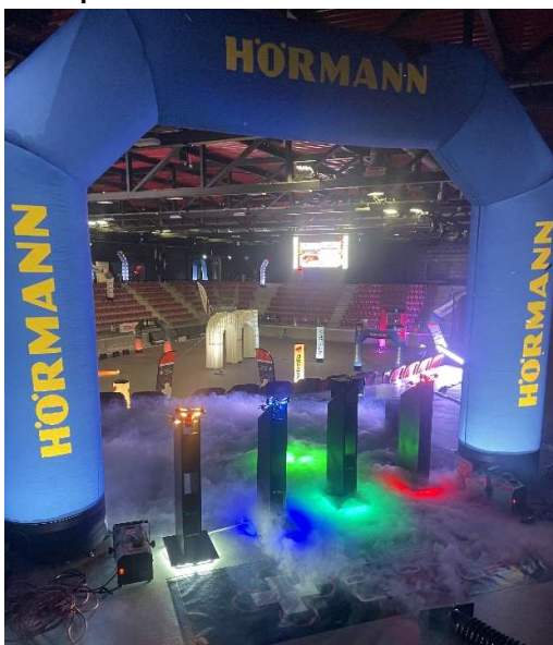
Zone de départ du CS 23