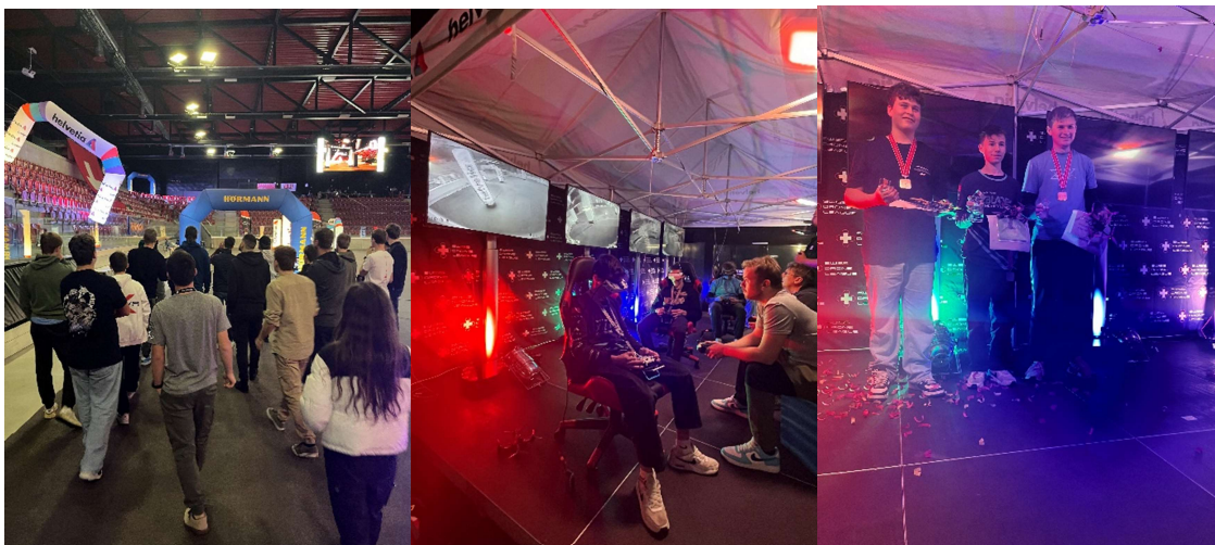
Track-Walk des pilotes CD 23

Organiser des événements de grande envergure tels que les championnats suisses et les rendre accessibles au grand public demande un énorme travail et n'est possible qu'avec des partenaires fiables et de nombreux soutiens. Nous tenons à remercier ici Hörmann, TCS Training & Events, Toshiba TEC, Helvetia Assurances, Integra et Maxon.