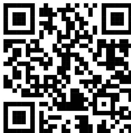
Code QR pour la vidéo du CS 23