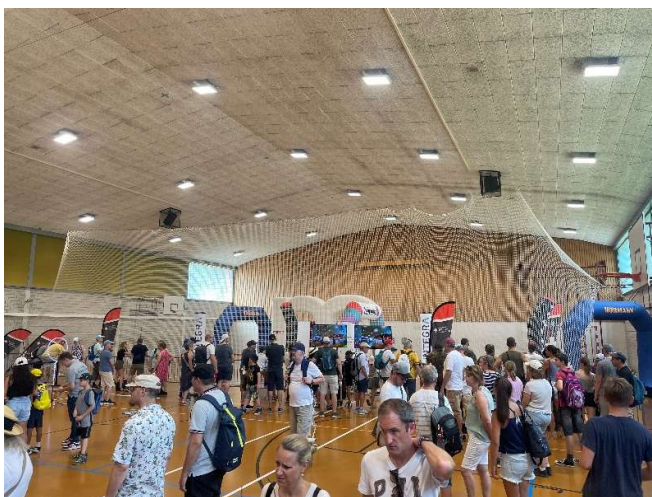
Drones Arena au salon CONNECTED avec 40'000 visiteurs