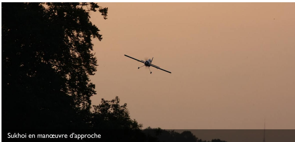
Sukhoi en manœuvre d'approche

Le FLARM pour terrains d'aéromodélisme est un autre projet à développer dans le domaine Infrastructure et sécurité. Les bases ont été posées à cet effet en 2014 et les travaux de développement d'un prototype ont été amorcés. Ces appareils permettent aux pilotes de modèles réduits d'être avertis de la proximité d'aéronefs avec équipage (planeurs, hélicoptères de la Rega, motoplaneurs équipés de FLARM, etc.), alors qu'inversement les pilotes de tels aéronefs sont informés sur l'activité d'aéromodélisme dans leur direction de vol. Des exercices en situation réelle auront lieu en 2015 dans différentes associations. En 2016, les appareils devraient être disponibles pour celles-ci à un prix abordable.